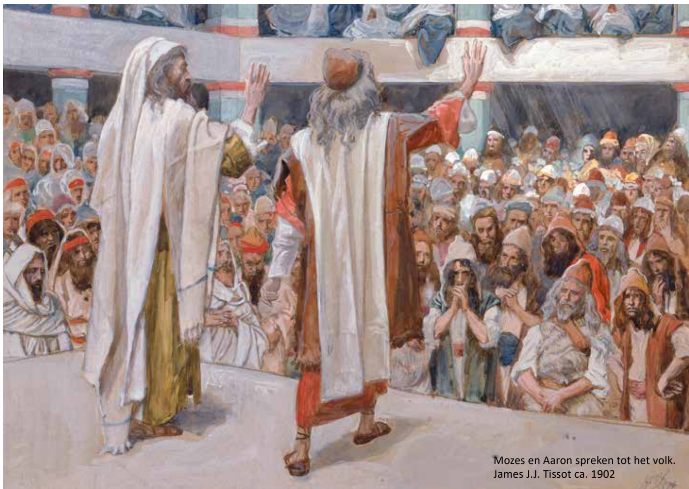
Mozes en Aäron spreken tot het volk. James J.J. Tissot ca. 1902

iemand anders zo iets doet). Dan denk ik dat wij de Heer, Die ons als Zijn werktuigen gebruikt, erg teleurstellen. Hij wordt niet teleurgesteld door onze kleinheid, bijv. als we zeggen: Heer, daar zie ik tegen op. Of Heer, daar ben ik niet geschikt voor. Als dat echt nederigheid is, wordt de Heer niet teleurgesteld. Dan zal Hij ons versterken en ons bemoedigen, zoals Hij dit met Mozes deed. Maar op het moment dat je onder een plicht uit wilt, dat kan Hij niet accepteren. Dan zegt Hij het volgende – en laten we het maar lezen, want het is ook een les voor mij en voor ons allemaal: ‘En Hij zei: Aäron, de Leviet, is toch uw broer? Ik weet dat hij uitstekend spreken kan. Bovendien, zie, hij trekt u tegemoet’. God had het geregeld, het was helemaal voor elkaar. Aäron was al in aantocht. ‘Zodra hij u ziet, zal hij zich van harte verblijden. Dan moet u tot hem spreken en hem en de woorden in zijn mond leggen. Ikzelf zal met uw mond en zijn mond zijn en u leren wat u doen moet. En hij zal voor u tot het volk spreken. Dan zal het zó zijn: Hij zal voor u tot een mond zijn en ú zult voor hem tot een god zijn’ (Ex. 4:14-16). Mozes moest tegen Aäron zeggen wat er meegedeeld moest worden aan het volk. Aäron was de spreekbuis.