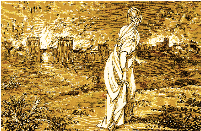
De vrouw van Lot door Janine Elkouby

Het is waar dat men in deze tijd heel actief is om maar snel zorgeloos te kunnen gaan rusten. Men wil graag zeggen: 'Ziel, u hebt veel goederen liggen voor veel jaren. Neem rust, eet, drink en wees vrolijk. Maar God zei tegen hem: