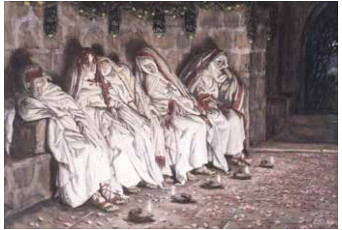
De wijze maagden; The Brooklyn Museum; James Tissot (1836-1902).

'Dan zal het koninkrijk der hemelen gelijk zijn geworden aan tien maagden die hun lampen namen en uitgingen