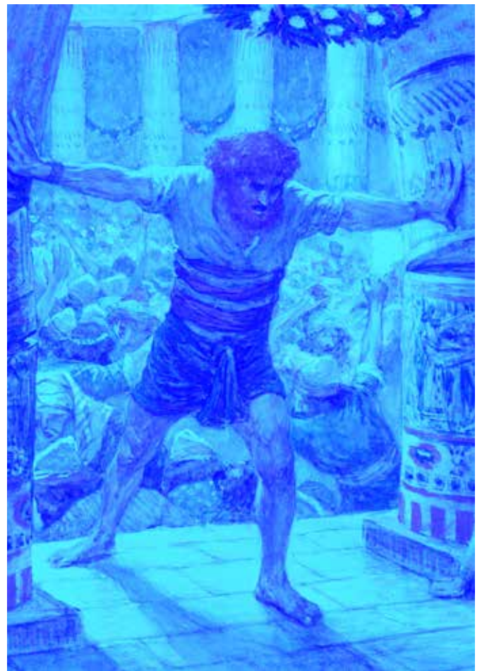
Samson duwt de Pilaren om, door James Tissot

Verder moeten wij nog wijzen op een groot verschil tussen Simsons optreden en dat van eerdere richters die Israël richtten. Simson stond namelijk helemaal alleen . Zoals een Antipas stond hij op een gegeven moment zelfs helemaal alleen tegenover zijn eigen volksgenoten (15:11-13; vgl. Openb. 2:13). Dit was in eerdere geschiedenissen in het boek Richteren totaal anders. De richters hadden altijd medestrijders, ook al werd hun aantal soms gereduceerd om God alleen de eer te geven voor de overwinning (vgl. Richt. 7:2). Simson had echter geen helpers in zijn strijd tegen de Filistijnen. De Israëlieten berustten in hun lot en kozen niet de zijde van hun bevrijder.