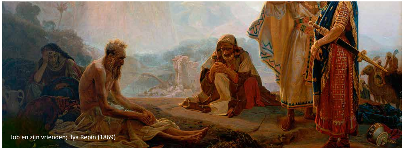
Job en zijn vrienden; Ilya Repin (1869)