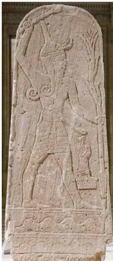
Afbeelding van Baäl in kalksteen. Gevonden in Ugarit, West-Syrië. Datering ca. 1500-1300 v. Chr. (Louvre).

wel frappant dat de weduwe over de God van Elia spreekt als over 'dé Heer'. In haar heer, nl. Baäl, was ze ondertussen haar vertrouwen kwijt. Baäl was namelijk niet zomaar een afgod, maar de belangrijkste in de Sidonische afgodendienst. Baäl was de god van de donder, de storm, de regen en de oorlog. De donder en de storm waren elementen, die niet begrepen werden en toegeschreven werden aan een machtige god. De regen was de noodzakelijke voorwaarde voor de oogst, en die moest dus ook een belangrijke god hebben. Dat de oorlog een machtige god nodig had, is nogal evident. En dat alles kwam deze ene Baäl toe. Baäl was dan ook echt de regengod, en daarmee ook de god van de vruchtbaarheid (op alle gebied, met alle gevolgen van dien). Nu begrijpen we ook waarom God juist het onthouden van alle regen als oordeel over Israël bracht wegens de afgodendienst rond de Baäl (vgl. Deut. 11:16-17). Dit raakte de Baäldienst diep in het hart, omdat het toonde dat Baäl het niet voor het zeggen had als het om regen en zegen van boven ging. De regengod had het niet doen regenen en er was hongersnood en de weduwe was aan haar laatste maaltijd toe. Haar god Baäl had gefaald, moest ze dan nu haar vertrouwen stellen in de God van deze vreemdeling? Stel het je eens voor!