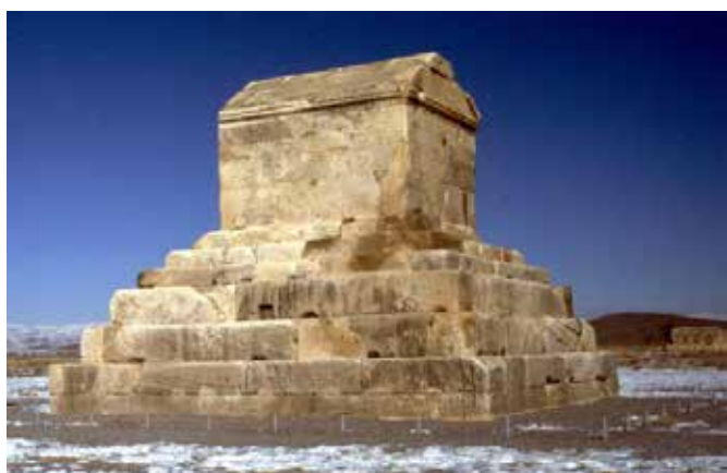
Het graf van Cyrus (Kores) in Pasargadae.

Dit zijn de omstandigheden, die ons in Ezra 1 worden voorgesteld. Maar die situatie beantwoordt helemaal niet aan wat er straks zal gebeuren bij de wederkomst van Christus. Want in plaats dat de volken oppermachtig zijn, is het Gods plan en bedoeling – wat wij allen weten vanuit de Schrift – dat Israël het hoofd zal zijn en de volken de staart. En feitelijk stelt dit alleen ons in staat om de geschiedenis van de wereld te begrijpen en de bijzondere toestand sinds de dag dat de tijden van de volken zijn begonnen. De mens heeft zich lang beroemd op deze tijd, die God de tijden van de heidenen noemt. Was het naar de gedachten van God? Een toestand van verwarring, die alleen door Gods voorzienigheid wordt geleid, doordat Hij de laagste van de mensen aanstelt om over de wereld te regeren? Zo spreekt God erover, terwijl de volken zich erop beroemen dat grote mannen de wereld regeren! God karakteriseert deze tijd als een tussentijd, die alleen is aangebroken vanwege de afvalligheid van Israël. En daarom laat Hij in Zijn voorzienigheid toe, dat het kwaad de overhand zal krijgen. Wij kunnen ons niet een juist oordeel over de toestand van de wereld en haar geschiedenis vormen zonder dit te bedenken.