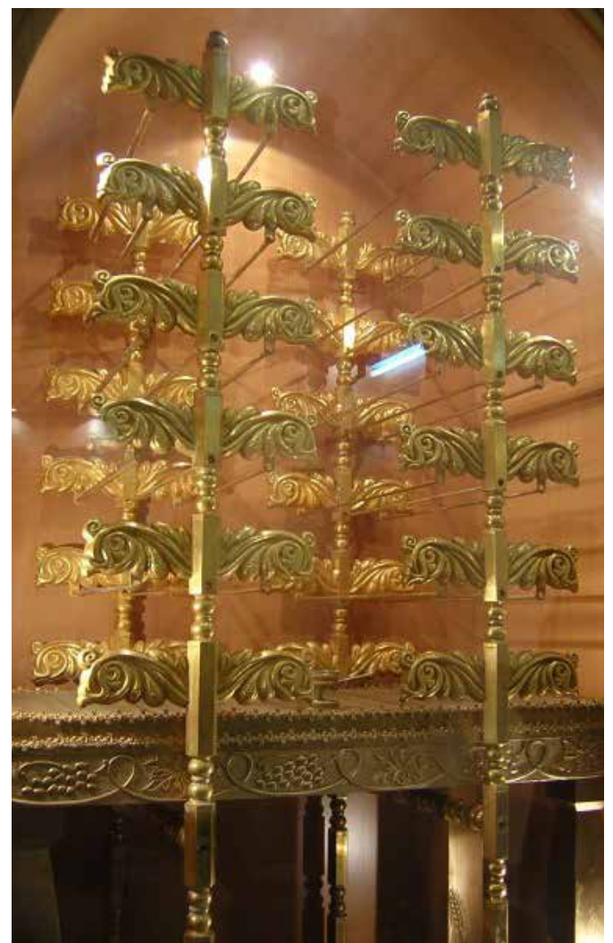
De gouden tafel van de toonbroden van het Tempelinstituut te Jeruzalem

De tafel was gemaakt van acaciahout, dat was overtrokken met zuiver goud. We hebben gezien dat de kandelaar was gemaakt van één stuk gedreven werk van één talent zuiver goud. Maar de tafel was gemaakt van hout én zuiver goud en de maten worden ons hier gegeven. Al deze specificaties hebben een betekenis en we moeten proberen het onderwijs ervan te begrijpen. Het hout toont de volmaakte mensheid van de Heer Jezus. Zoals we al zagen bij de kandelaar, wijst het zuivere goud op Zijn godheid. De toonbroden vertegenwoordigen de twaalf stammen van Israël, het complete volk van God; er ontbrak geen enkele stam. Er werd wierook op de broden gelegd, zodat ze aangenaam waren voor God. Dit spreekt van Christus als Mens. Hij leeft in de tegenwoordigheid van God. Hij is de Ene die aan God gelijk is, maar hier wordt Hij gezien als Degene die in staat is de gelovigen te dragen en op een God welgevallige wijze te ondersteunen.