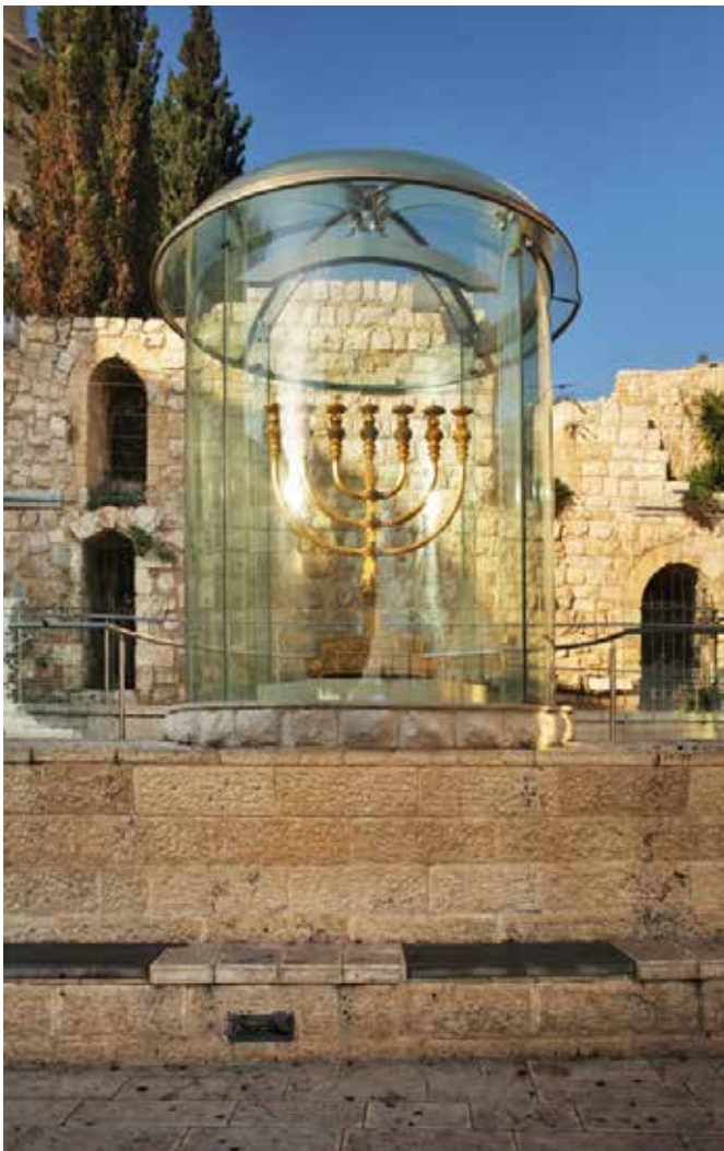
De gouden menorah van het Tempelinstituut te Jeruzalem

Allereerst zullen we de kandelaar bezien. We lezen de instructies hoe deze gemaakt diende te worden in Exodus 25:31-40. We zullen een stukje hiervan lezen: 'U zult een kandelaar van louter goud maken, van gedreven werk zal de kandelaar zijn'. Hij had een centrale schacht met drie armen die eruit kwamen aan elke zijde, versierd met bloemkelken, knoppen en bloesems, en met een bakje voor de olie aan het uiteinde van iedere arm. Hij moest uit één stuk gedreven