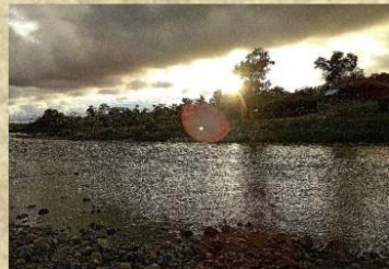
Atardecer en la comunidad Playa Bonita