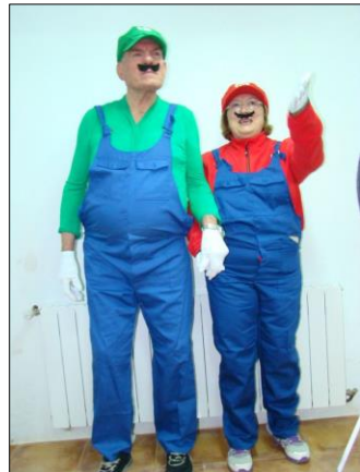
En uno de los campamentos...