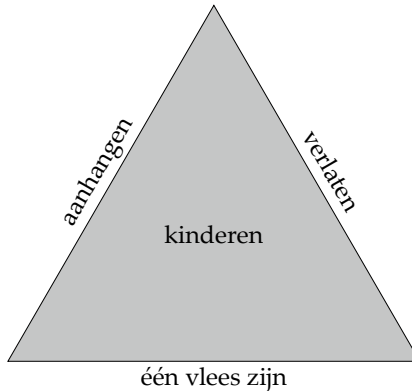
Afbeelding 1: huwelijksband en kinderzegen

tegenover de kinderen hen te verwekken buiten de onderstaande driehoek