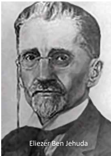
Eliezer Ben Jehuda

Tijdens de Krimoorlog in het jaar 1853 werd er gevochten over de rechten van Palestina. Rusland viel Turkije aan. Turkije riep de hulp van Engeland en Frankrijk in. Rusland verloor deze oorlog. In dat jaar was er een Joodse minister-president in Engeland, die verlangde naar een Joods thuisland. Zijn naam was Benjamin Disraëli.