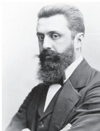
Theodor Herzl (1860-1904)

Herzl maakte een bezoek bij de Turkse sultan, die erg onder de indruk was en het Land aanbood voor twintig miljoen dollar. Herzl kon de Joodse bevolking niet overhalen om dit bedrag te betalen. Hij stierf aan een hartaanval op drie juli in het jaar 1904. Hij had echter iets op gang gebracht dat niet meer te stoppen was.