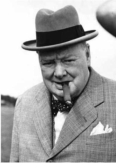
Sir Winston Churchill