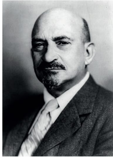
Dr. Chaim Weizman

niets voor mijzelf, maar wel een thuisland voor mijn Joodse volk. Hij ontving de hoogste onderscheiding en werd later de eerste president van Israël.