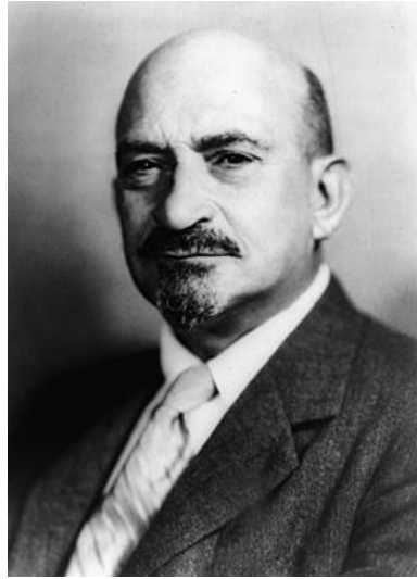
Dr. Chaim Weizman

mijzelf, maar wel een thuisland voor mijn Joodse volk. Hij ontving de hoogste onderscheiding en werd later de eerste president van Israël.