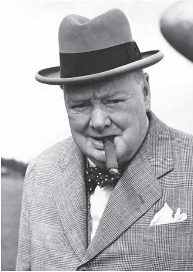
Sir Winston Churchill