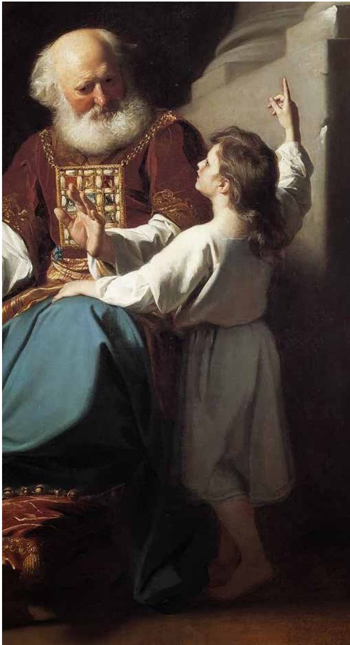
Samuël spreekt over het oordeel over het huis van Eli. John Singleton Copley, 1780.

Dit offer wordt in de Schrift altijd verbonden met het brandoffer, dat wel een bloedig offer was. Nadat Christus tijdens Zijn leven op aarde in iedere beproeving Zijn volkomenheid had getoond, offerde Hij Zichzelf op het kruis als brandoffer tot een aangename geur voor God. Het was een volkomen Persoon, die een volkomen werk volbracht tot eer van God de Vader. Wanneer wij nu als priesters tot God mogen naderen, dan is dat alleen dankzij de waarde van de Persoon en het werk van Christus. Wij zijn aangenaam gemaakt in de Geliefde, en komen in die waardigheid bij God.