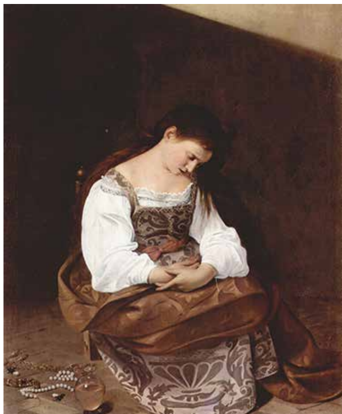
Maria Magdalena door Michelangelo Caravaggio, 1594 -1596

Het enige dat haar vervulde vanaf de dag van haar redding was intense liefde voor Hem. Ze had Hem lief, die haar het eerst had liefgehad (1 Joh. 4:19). En liefde vindt alleen voldoening in de nabijheid van de persoon op wie zij zich richt. Daarom was Maria Magdalena in de nabijheid van Jezus. Ze was bij Hem, toen haar hart overstroomde van blijdschap vanwege haar verlossing uit de macht van de satan. Ze was bij Hem in de moeiten van Zijn pelgrimsleven.