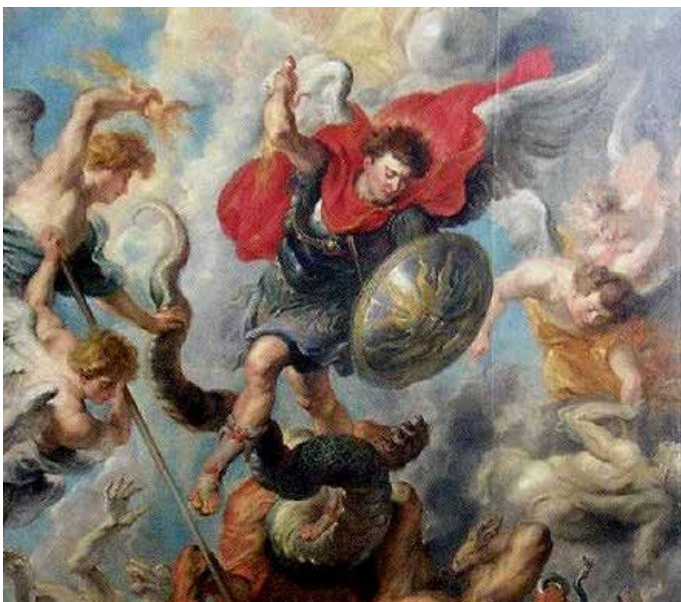
Oorlog in de hemel door Pieter Paul Rubens (1619).

Het verband tussen deze verzen kan als volgt worden omschreven: in het begin van dit hoofdstuk zien we het volk Israël uitgebeeld als een vrouw die op het punt staat te bevallen. Zij baart een zoon waarvan wordt gezegd dat hij de naties zal hoeden met een ijzeren staf, maar daarna wordt hij weggerukt naar God en Zijn troon. Als we dit vergelijken met Psalm 2, blijkt al gauw dat deze zoon de Christus is, die is voortgekomen uit het volk Israël en na Zijn kruisdood naar God is teruggekeerd. Over de vrouw wordt gezegd dat ze in de woestijn vlucht, waar God haar 1260 dagen – dat is drieënhalf jaar – behoedt en bewaart (zie ook het hoofdstuk 'De Grote Verdrukking'). In de verzen 13-17 lezen we dat de vrouw vlucht, omdat zij vervolgd wordt door de draak die op de aarde is neergeworpen.