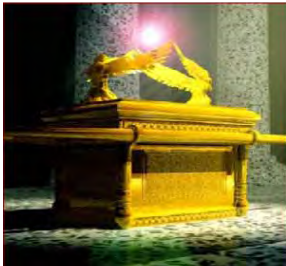
De ark van het verbond

De gouden kruik met manna is één van de voorwerpen waarover in bijzonderheden gesproken kan worden. Deze kruik was zeer kostbaar in de ogen van God. Dit blijkt uit het feit dat ze werd bewaard in het heilige der heiligen, specifiek gezegd: in de ark van het verbond die voor Gods aangezicht stond. De ark en het verzoendeksel spreken van Christus in Zijn godheid, mensheid en verzoenend sterven aan het kruis.