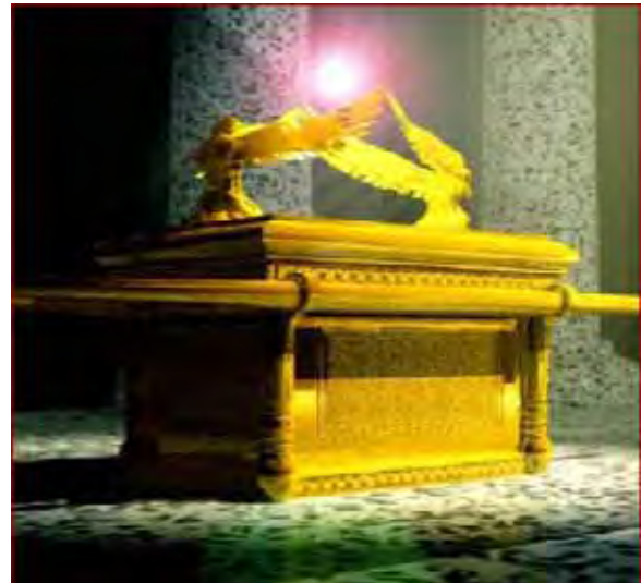
De ark van het verbond

De gouden kruik met manna is één van de voorwerpen waarover in bijzonderheden gesproken kan worden. Deze kruik was zeer kostbaar in de ogen van God. Dit blijkt uit het feit dat ze werd bewaard in het heilige der heiligen, specifiek gezegd: in de ark van het verbond die voor Gods aangezicht stond. De ark en het verzoendeksel spreken van Christus in Zijn godheid, mensheid en verzoenend sterven aan het kruis.