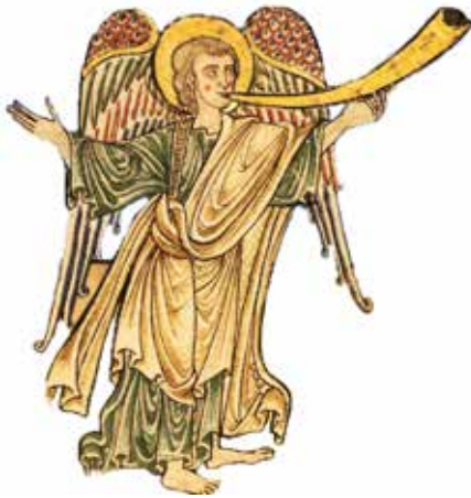
De zevende engel.

Dit ingrijpen van God zal plaatsvinden ten tijde van het laatste bazuinoordeel, zoals wordt aangekondigd in Openbaring 10:5-7. Er zal dan geen uitstel meer zijn en God zal Zijn grote majesteit duidelijk tonen. Wij lezen hier de volgende profetie: 'En de engel die ik op de zee en op de aarde zag staan, hief zijn rechterhand op naar de hemel, en zwoer bij Hem die leeft tot in alle eeuwigheid, die de hemel heeft geschapen en wat daarin is en de aarde en wat daarop is en de zee en wat daarin is, dat er geen uitstel meer zal zijn; maar in de dagen van de stem van de zevende engel, wanneer hij zal bazuinen, zal ook de verborgenheid van God voleindigd worden, zoals Hij aan Zijn slaven, de profeten, heeft verkondigd'.