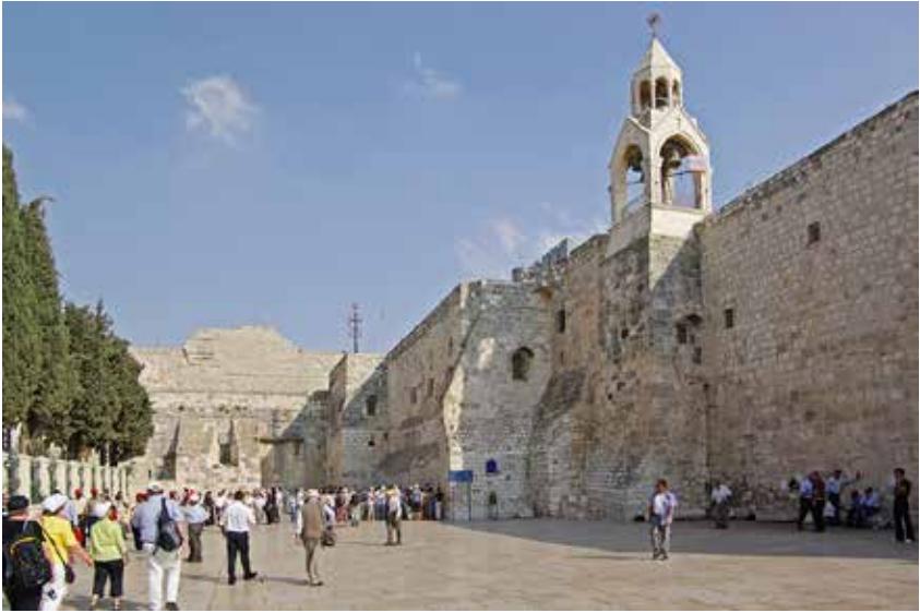
Plein voor de geboortekerk in Betlehem.

(4) In Christus werd de genade van God geopenbaard voor een verloren wereld. Het heil dat in Hem werd gezonden, beperkte zich niet tot het Joodse volk, hoewel het wel uit de Joden is (Joh. 4:22). Christus is 'gepredikt onder de volken', 'verkondigd onder de heidenen'.