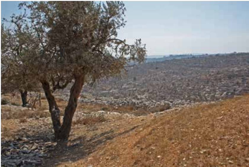
De velden bij Betlehem.

zijn geworden van de wortel en de vettigheid van de boom. De belofte van de goddelijke zegen voor de aartsvader Abraham is de wortel van de boom. In Christus is die zegen nu ook tot de volken gekomen, mits wij evenals Abraham zijn gerechtvaardigd op grond van het geloof (Rom. 4:1-25). Zij die op grond van geloof zijn, worden met de gelovige Abraham gezegend. Als wij het eigendom van Christus zijn, dan zijn wij Abrahams nageslacht en volgens belofte erfgenamen (Gal. 3:1-29).