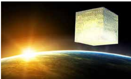
Het nieuwe Jeruzalem dat neerdaalt uit de hemel.

In deze reeks van tien verborgenheden hebben we dus een overzicht van Gods plannen, allereerst met betrekking tot Christus Zelf en de Gemeente die Hem toebehoort en die nauw met Hem verbonden is. Christus en de Gemeente vormen het grote onderwerp van Gods raadsbesluiten. We zien echter ook dat de Gemeente niet heeft beantwoord aan haar verantwoordelijkheid als Gods getuigenis op aarde. Gelukkig wordt de ware Gemeente opgenomen in heerlijkheid. De schijnkerk wordt geoordeeld, en daarna verschijnt Christus met de hemelse bruidsgemeente. Hij voert Gods gerichten uit over Zijn vijanden en verlost ook Zijn aardse volk Israël.