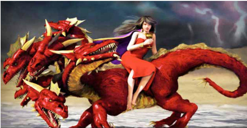
De vrouw op het scharlakenrode beest

In schril contrast hiermee vinden we in de volgende hoofdstukken de beschrijving van de ware kerk, de bruid van het Lam, die eveneens als een stad wordt voorgesteld: de stad van God, het Nieuwe Jeruzalem, de regeringszetel van God en van het Lam (Openb. 19:6-22:5). Wanneer de grote hoer is geoordeeld, verbindt Christus Zich openlijk met de ware bruidsgemeente en verschijnt Hij ook met haar in heerlijkheid. Het is telkens één van de zeven engelen die de zeven schaalordelen uitvoerden, die uitleg geeft aan Johannes over de twee bruiden en de twee steden (Openb. 17:1; 21:9).