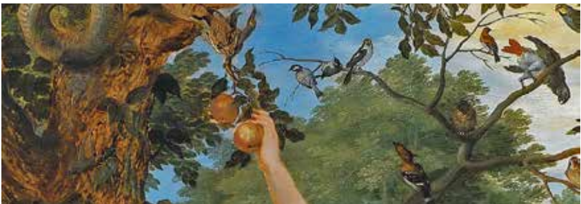
Detail ' Het aards paradijs met de zondeval van Adam en Eva '. Schilderij van Jan Brueghel de Oude en Peter Paul Rubens (1615)

C hristus en de Gemeente staan in het centrum van Gods plannen en gedachten. Het is de verborgenheid van Zijn wil om in de volheid van de tijden alles in de hemelen en op de aarde onder één Hoofd samen te brengen in Christus (Ef. 1:9-10). De Gemeente, die het lichaam is van het Hoofd, deelt in deze rijke erfenis, die overigens nog moet worden verlost van de macht van de tegenstander en van de slavernij van de vergankelijkheid (Rom. 8:18-25; Ef. 1:11-14). God heeft Christus gesteld tot Erfgenaam van alle dingen. De eerste mens, Adam, heeft gefaald nadat hij door God als onderkoning was aangesteld over de eerste schepping (Gen. 1:26-28).