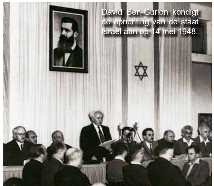
David Ben-Gurion kondigt de oprichting van de staat Israël aan op 14 mei 1948.

In het boek van de profeet Ezechiël vinden we in hoofdstuk 37 een uitvoerige illustratieve beschrijving van het nationale en latere geestelijke herstel van Israël. Ezechiël ziet in dat hoofdstuk verdorde doodsbeenderen die bij elkaar komen en waar overheen spieren, vlees en huid komen. Hierin zien we het nationale herstel (vs. 1-8). Het geestelijke herstel dat daarop volgt, vindt plaats als God met Zijn adem in het volk blaast en het op deze manier tot leven wekt (vs. 9-14).